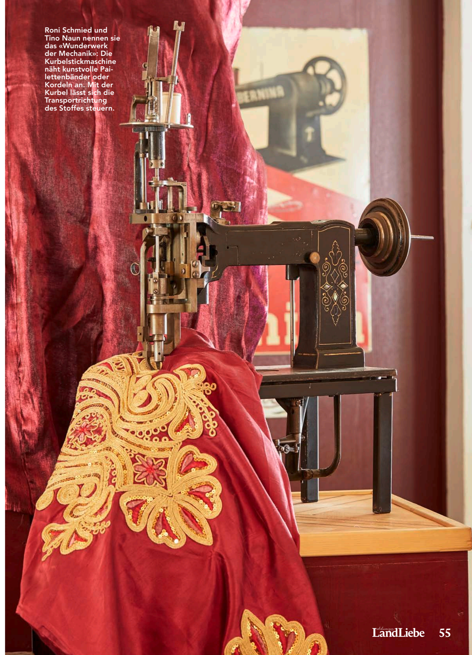
Roni Schmied und Tino Naun nennen sie das «Wunderwerk der Mechanik»: Die Kurbelstickmaschine näht kunstvolle Paillettenbänder oder Kordeln an. Mit der Kurbel lässt sich die Transportrichtung des Stoffes steuern.

Text Sabrina Glanzmann