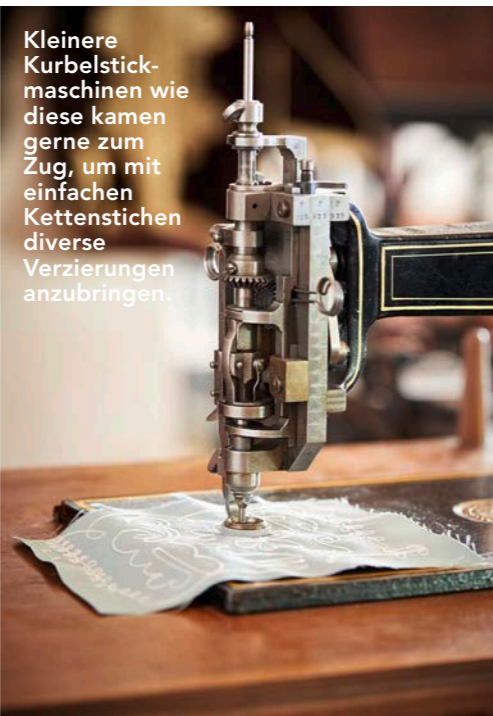
Kleinere Kurbelstickmaschinen wie diese kamen gerne zum Zug, um mit einfachen Kettenstichen diverse Verzierungen anzubringen.