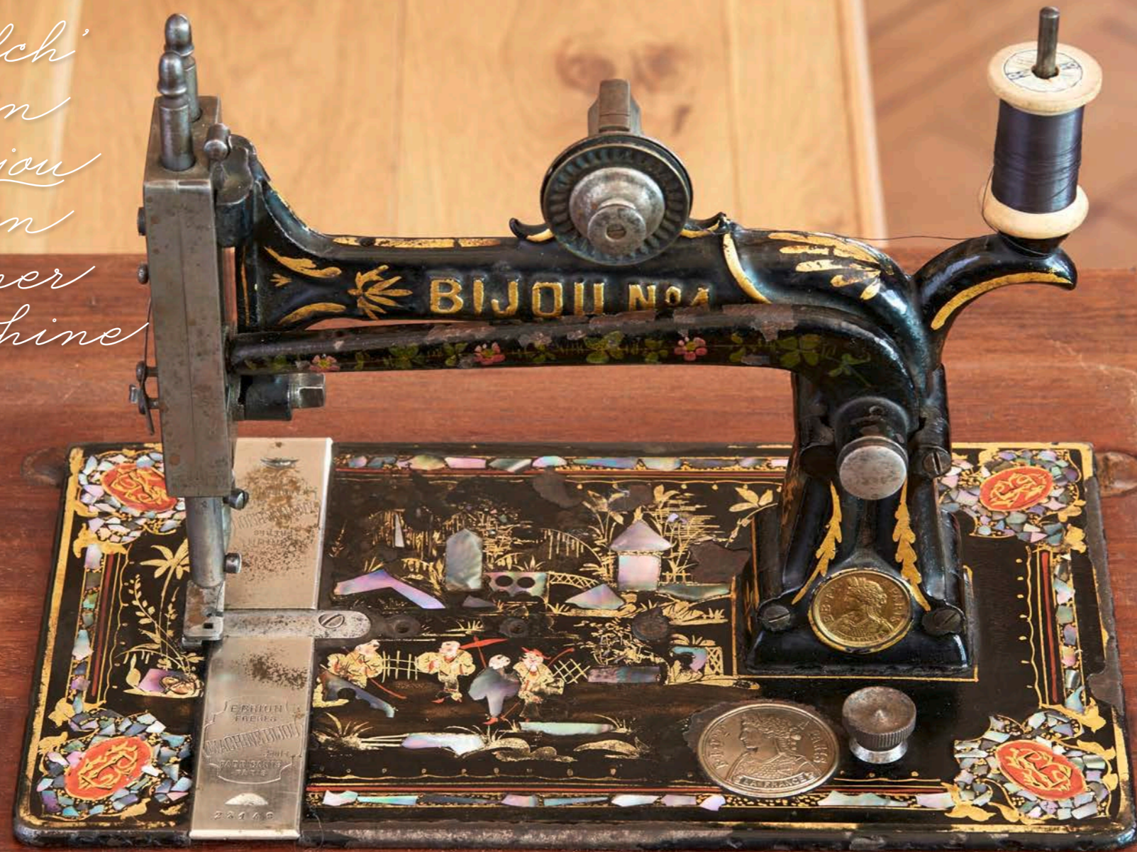
Nomen est omen: Die Bijou No. 1 wurde im Jahr 1870 in Frankreich hergestellt. Ihren grosszügigen schmückvollen und glänzenden Einlagen aus Gold und Perlmut sei Dank zieht sie garantiert alle Blicke auf sich.