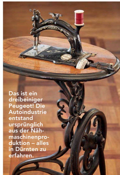
Das ist ein dreibeiniger Peugeot! Die Autoindustrie entstand ursprünglich aus der Nähmaschinenproduktion – alles in Dürnten zu erfahren.