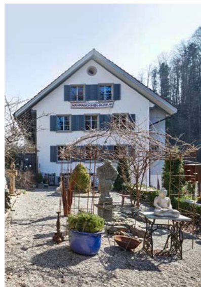
Im grosszügigen Garten können Museumsgäste auf Wunsch auch ein gemütliches Apéro geniessen.

Roni die Fundstücke sorgfältig in seiner Werkstatt, damit sie im «Wimmelbild-Laden» bald wieder auf ihren nächsten Besitzer, ihre nächste Besitzerin warten können. «Ich habe es wohl einfach im Blut, antike Schätze aufzuspüren. Ich nenne es eine Spinnerei aus Berufung», sagt Roni lachend, als wir