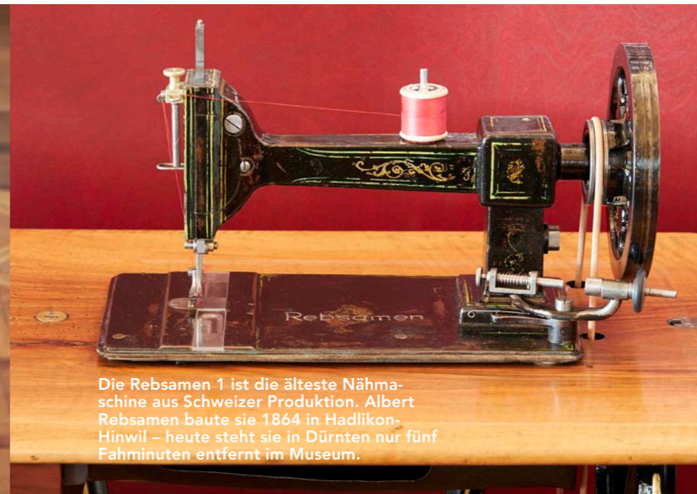
Die Rebsamen 1 ist die älteste Nähmaschine aus Schweizer Produktion. Albert Rebsamen baute sie 1864 in Hadlikon-Hinwil – heute steht sie in Dürnten nur fünf Fahminuten entfernt im Museum.

nicht ganz durch den Stoff stechen – so entstand eine neue Nähtechnik, die alles, was danach folgte, erst ermöglichte.